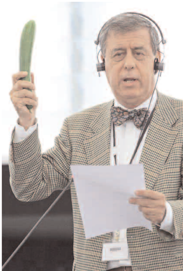
El eurodiputado Francisco Sosa Wagner durante el debate de la crisis del pepino.